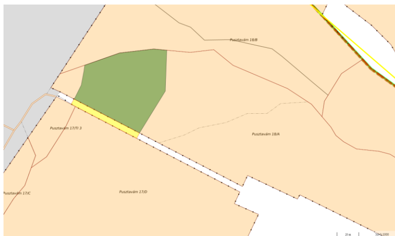
2. térkép: Felvonulási bruttó terület