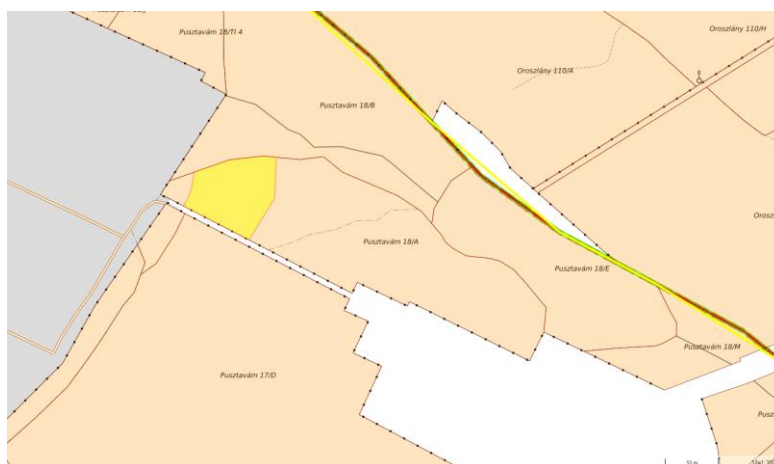
1. térkép: Beavatkozással érintett nettó terület